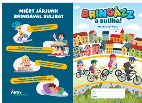
Tanulói matricagyűjtő füzetek