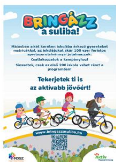
Program tájékoztató plakát